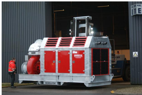
Nordjysk Grundvandssænkning råder over Danmarks hidtil største mobile dieseldrevne pumpe.

Se artiklen om Danmarks største mobile pumpe.