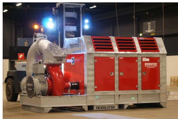
Pumpen blev præsenteret på "Kloakmessen 2016" i Fredericia.